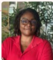
Grace Ingénieure Qualité Produits

« Le changement des ingrédients, avec des objectifs ambitieux pour 2026, comme le cacao certifié ou les œufs hors cage, reflète un véritable travail de fond pour aligner nos pratiques avec des valeurs durables. »