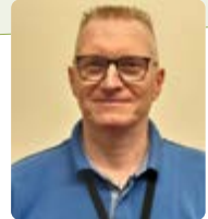
Claude Exploitant Transports

« Tester le camion électrique, est une vraie opportunité. On voit concrètement comment, réduire notre impact environnemental et notre empreinte carbone, tout en gardant l'efficacité terrain. »